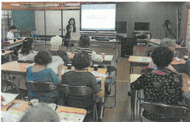
お茶やお菓子をいただきながらの講座の様子

* 開催日等条件によっては、派遣のご希望に添えないこともございますので、あらかじめご了承ください。